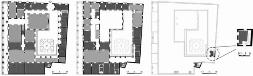
Figura 1. Estado Actual de Utilización de Espacios en la Biblioteca Provincial 'Martí'. El color gris significa áreas de atención a los usuarios: salas de lectura, navegación y multipropósito. El color negro significa locales de gestión interna: oficinas, almacenes de fondos documentales e insumos.