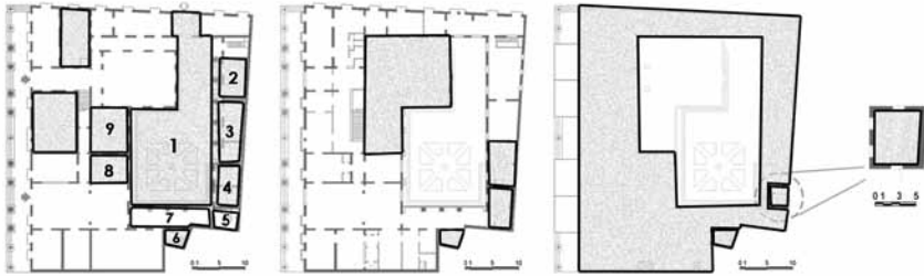
Figura 5. Propuesta de Espacios y Servicios en la Biblioteca Provincial ‘Martí’: 1) Patio; 2) Talleres de Aprendizaje (Makerspaces); 3) Cafetería; 4) Incubadora Económica; 5) Servicios Sanitarios; 6) Servicios Gráficos; 7) Galería para la consulta de la prensa; 8) Laboratorio de aprendizaje y creación digital; 9) y Sala Multipropósito.