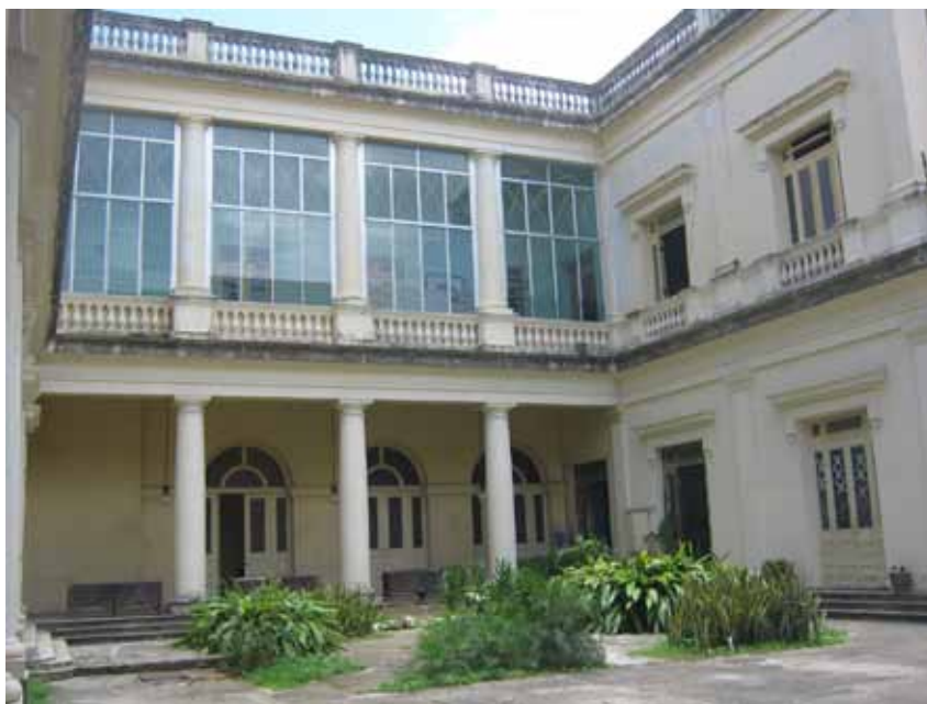
Figura 4. Estado Actual del Patio Central del Palacio del Gobierno Provincial.